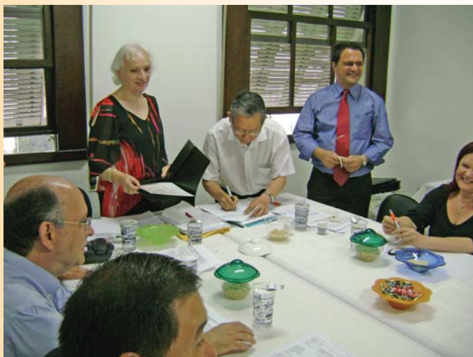
Reunião da Posse “Sindióptica-SP”